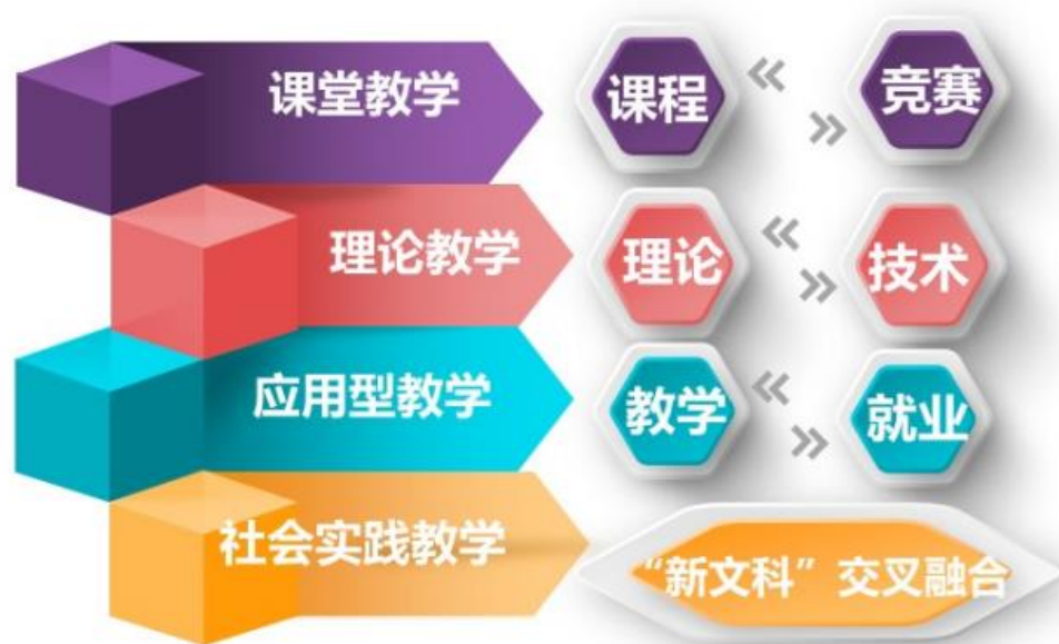
图5：“三通四合”实践效果

践平台、实践环节、实验层次“四个层面”互助互哺的实践教学机制，打造了三个过程、四个平台、五个环节、六个层次的“三四五六”实践教学模式。打破了理论与技术壁垒，打通了教学与实践屏障，链接了校内师资与行业专家渠道，实现了理论与技术结合、不同学科专业融合、课程与竞赛汇合、教学与就业吻合的“三通四合”培养效果。（见图5）