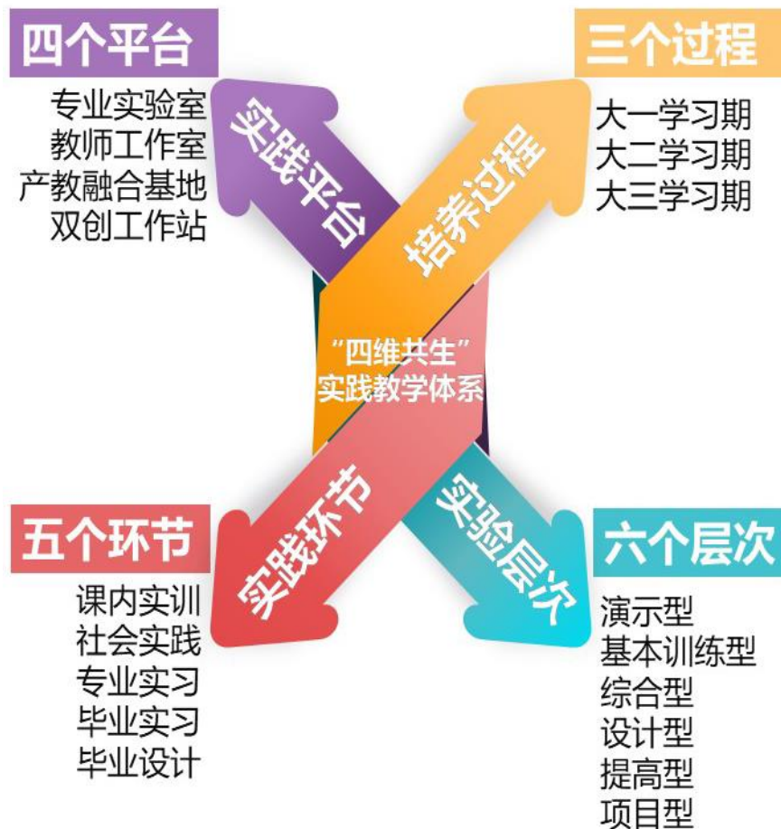
图 3：“四维共生”实践教学体系

(3) 打造双师双能型协同育人师资团队，构建“五位一体”全链条实践教学模式。大力引进行业高水平专职教师，聘请行业专家作为实践教学兼职导师，校企联动加强现有教师团队专业技能培训，强化双师双能型师资团队建设，形成了学业、就业、行业“三导师”协同育人机制，通过虚拟教研室定期交流实践教学经验，推进产教深度融合。抓紧品牌专业课程建设，抓牢行业证书考取，抓细专业竞赛活动，抓严实习实训环节，抓实优质就业质量，“五位一体”协同推进，全面提升人才培养质量。